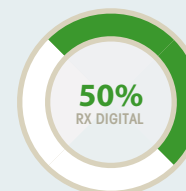
DOSE RADIOGRAFIE RX TRADIZIONALE E DIGITALE